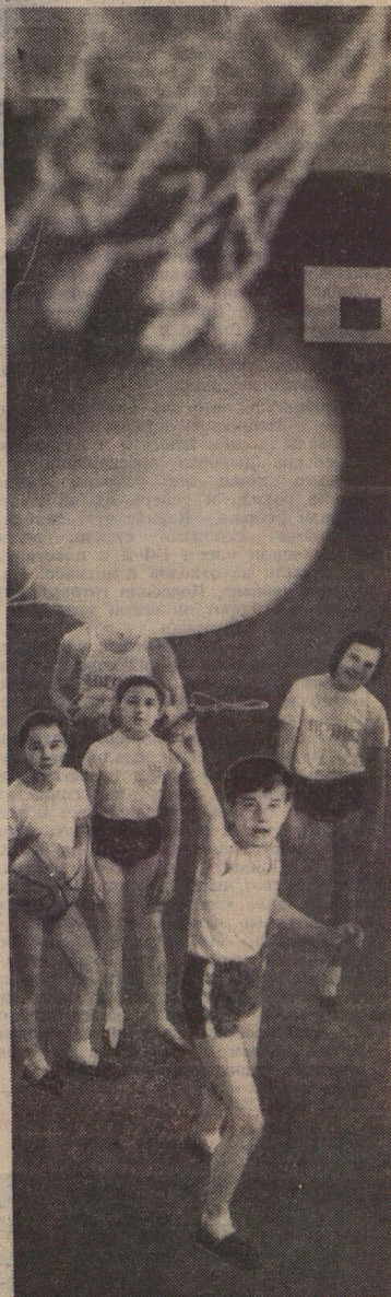
Для того чтобы сделать этот снимок, нашему фотожурналисту В. Гусеву пришлось встать на гимнастическое коны. И, впрочем, он немножечко побавился, но же кто-то промахнулся и попал в... фотокамеру. Но ребята метно поразили цель. Вот такие хорошие баскетболисты! в школе № 72 Киевского района Москвы.